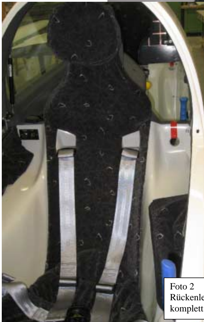
Foto 2 Rückenlehne komplett eingebaut